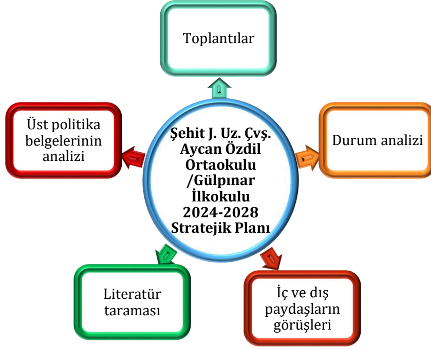
Şekil 1: Stratejik Plan Oluşum Şeması

Okulumuzun 2024-2028 stratejik planın hazırlanmasında tüm tarafların görüş ve önerileri ile eğitim önceliklerinin plana yansıtılabilmesi için geniş katılım sağlayacak bir model benimsenmiştir. Bu amaca ulaşabilmek için farklı fikirlerin plan metninde yer almasına ve değerlendirilmesine özen gösterilmeye çalışılmıştır. Stratejik plan temel yapısı Müdürlüğümüz Stratejik Planlama Üst Kurulu tarafından kabul edilen Müdürlük Vizyonu ulaşabilmek amacıyla eğitimin üç temel bölümü (erişim, kalite, kapasite) ile paydaşların görüş ve önerilerini baz alır nitelikte oluşturulmuştur.